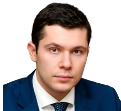
Антон Алиханов министр промышленности и торговли

“ У нас вагоностроительная отрасль крайне эффективно развивается, там очень высокий уровень локализации – 90% и выше по отдельным видам продукции. <...> Мы не поддерживаем изменение решения, которое в 2015 году было принято президентом.